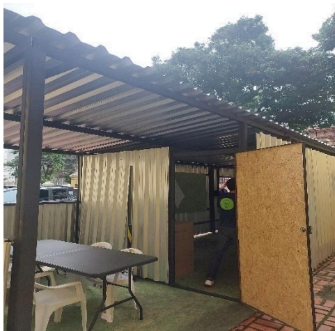
Canteiro de Obras. Data: 02/12/2024

Até o momento, foi realizada a instalação do canteiro de obras da equipe de execução das atividades, além da aquisição de parte dos materiais, que estão no canteiro. Para montagem do canteiro, que fica no espaço lateral do complexo, foi necessário realizar a proteção do piso, que também faz parte do tombamento do complexo, e precisa de cuidados para que não seja danificado.