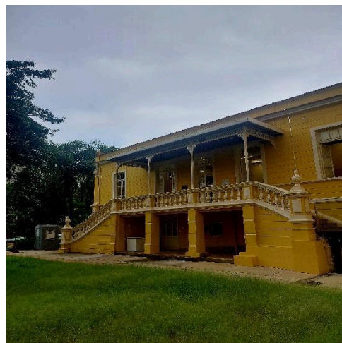
Complexo Cultural do Arquivo Público Mineiro. Data: 02/12/2024